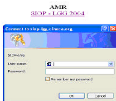
Figura II - Username e Password

Per ottenere Username e Password è necessario inviare una mail di richiesta all'International Data Centre dello studio (Servizio Sperimentazioni Cliniche e Biostatistica - IOV - cor.epiclin@unipd.it )