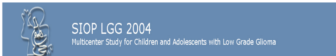
Figura III- Tool Bar

La TOOL BAR è visualizzabile nella parte superiore di ogni pagina web dello studio (vedi figura III).