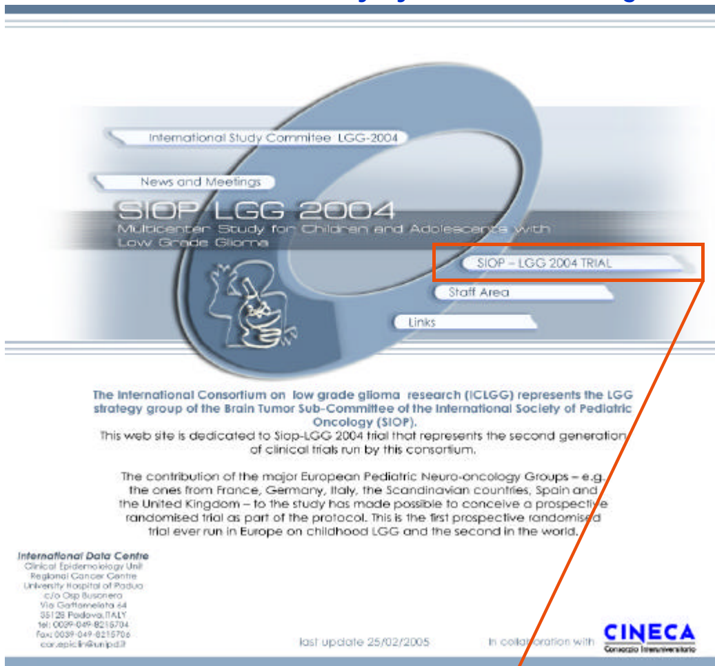
Figura1- RDE System Home Page

Cliccando sul Link SIOP-LGG 2004 TRIAL si accede alla Home Page dello studio.